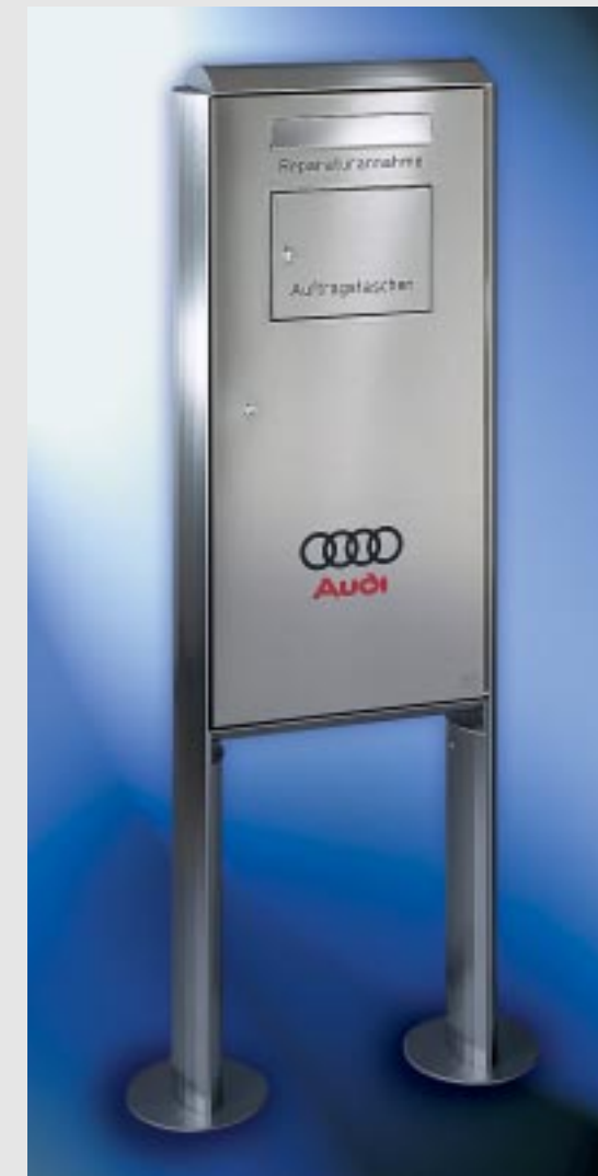
Abb. 243/1 Autohauskasten 455 x 990 x 145 mm für freistehende Montage. Convex-Verkleidungsgestell aus Edelstahl V4A. Integriertes Fach für die Entnahme von Auftragstaschen.