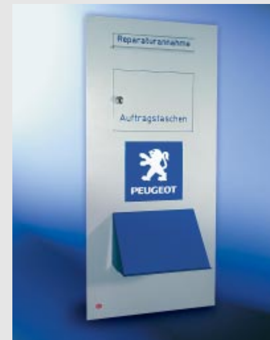
Abb. 243/2 Durchwurf-Autohauskasten 370x880x145 mm, für Montage im Türseitenteil, Einwurf vorne, Entnahme hinten, mit Fach für die Entnahme von Auftragstaschen, Schreibpult.