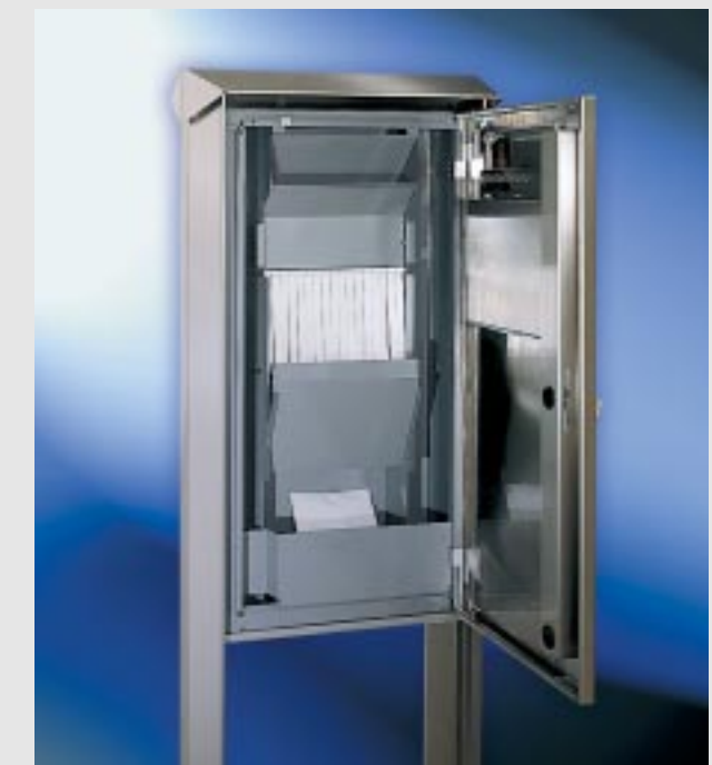
Abb. 243/3 Sicherheitsfallschacht mit zwei beweglichen Rückholsperren. Um die Funktion des Fallschachtes zu gewährleisten sowie ausreichend Volumen zu bieten, sollten folgende Mindestgrößen unbedingt eingehalten werden: • Freistehende Anlagen mindestens 455 x 990 x 145 mm • Anlagen im Türseitenteil mindestens 370 x 880 x 145 mm

Bitte beachten Sie, dass Versicherungsgesellschaften unterschiedliche Richtlinien für den Versicherungsschutz von Autohauskästen haben. Informieren Sie sich deshalb bitte vorab bei Ihrer Versicherungsgesellschaft nach den Anforderungen, die diese an Autohauskästen stellt.