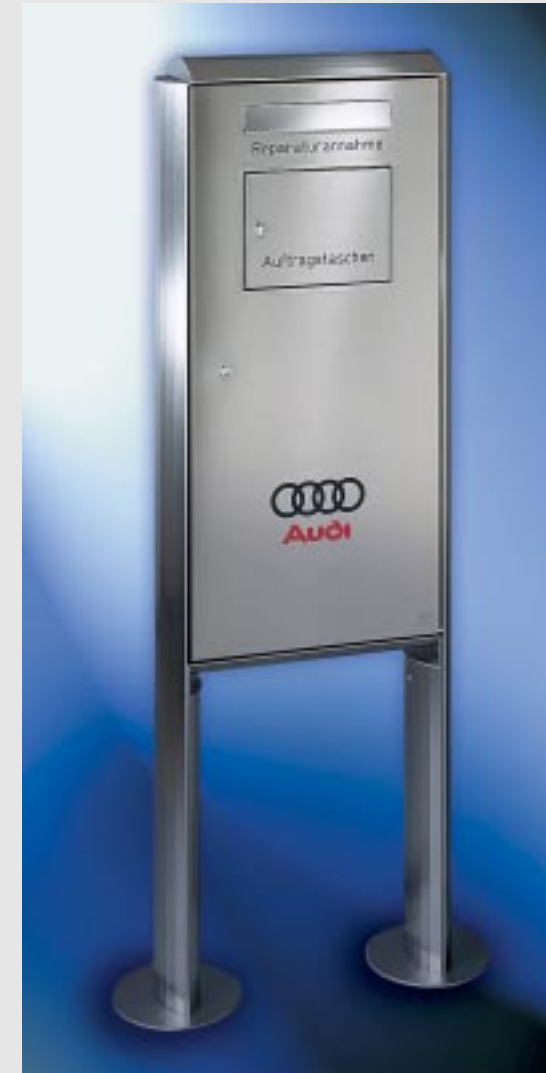
Abb. 243/1 Autohauskasten 455 x 990 x 145 mm für freistehende Montage. Convex-Verkleidungsgestell aus Edelstahl V4A. Integriertes Fach für die Entnahme von Auftragstaschen.