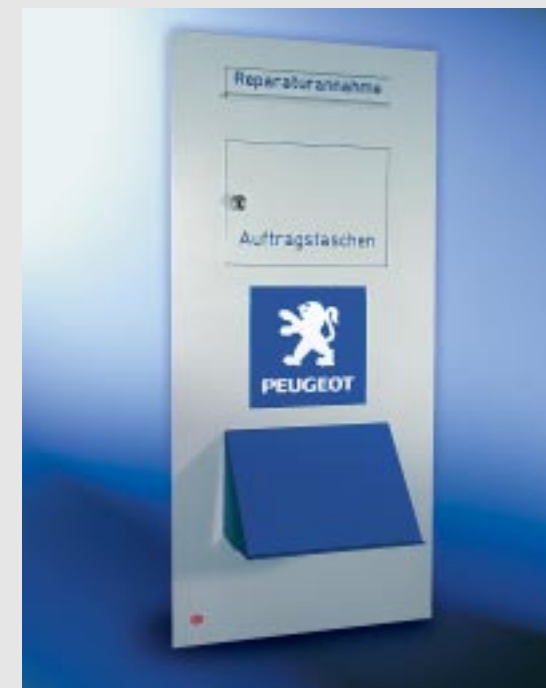
Abb. 243/2 Durchwurf-Autohauskasten 370x880x145 mm, für Montage im Türseitenteil, Einwurf vorne, Entnahme hinten, mit Fach für die Entnahme von Auftragstaschen, Schreibpult.

Bitte beachten Sie, dass Versicherungsgesellschaften unterschiedliche Richtlinien für den Versicherungsschutz von Autohauskästen haben. Informieren Sie sich deshalb bitte vorab bei Ihrer Versicherungsgesellschaft nach den Anforderungen, die diese an Autohauskästen stellt.