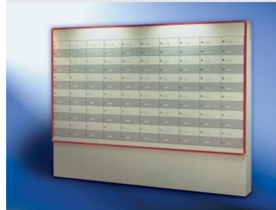
Abb. 231/3 Kastenformat-Sonderausführung als Raumtrenner, Verkleidung bauseits.

Preise auf Anfrage. Wir erstellen Ihnen gerne ein individuelles Angebot mit Zeichnung.