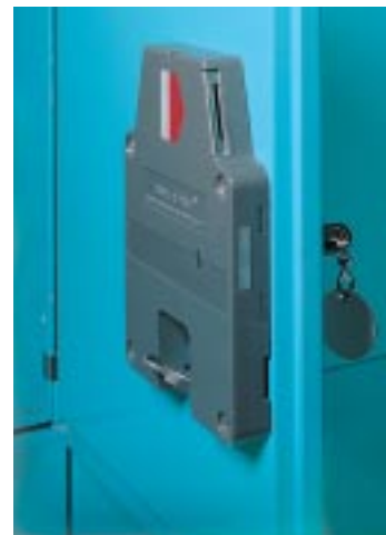
Abb. 230/1 Safe-o-mat-Pfandschloss.

Die richtige Lösung für das Aufbewahren von Gegenständen, Kleidern, Taschen usw. in Schulen, Sportstätten, Frei- und Hallenbädern, Betrieben, Büros, Einkaufszentren, Hotels, Krankenhäusern. Je nach Bedarf können verschiedene kleinere Fächer mit größeren kombiniert werden. Es gibt eine Vielzahl von Variationsmöglichkeiten.