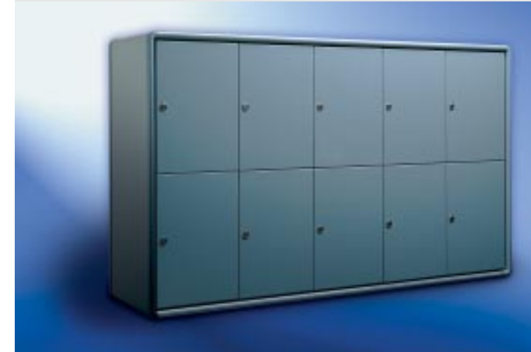
Abb. 231/1 Kastenformat-Sonderausführung, mit ALU-Rundkantenverkleidung RS 4000.