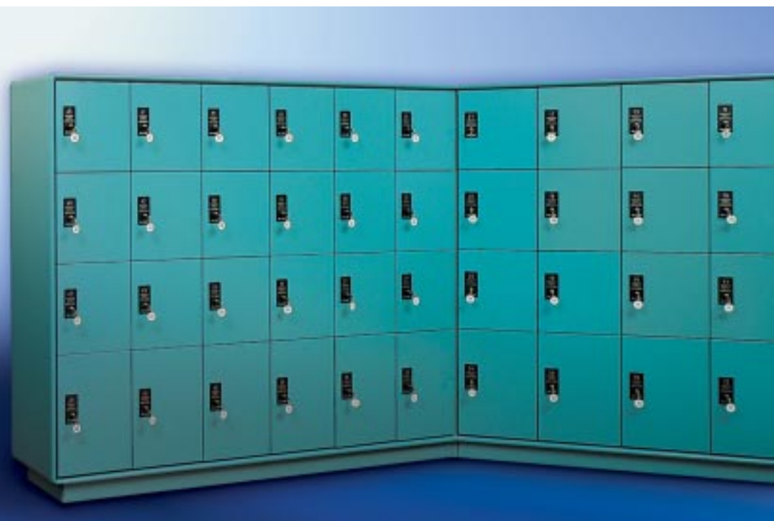
Abb. 230/3 Kastenformat-Sonderausführung als Raumtrenner, ALU-Rundkantenverkleidung RS 4000, Stahlblechsockel.