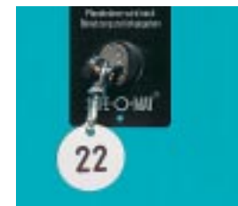
Abb. 230/2 Safe-o-mat-Pfandschloss.