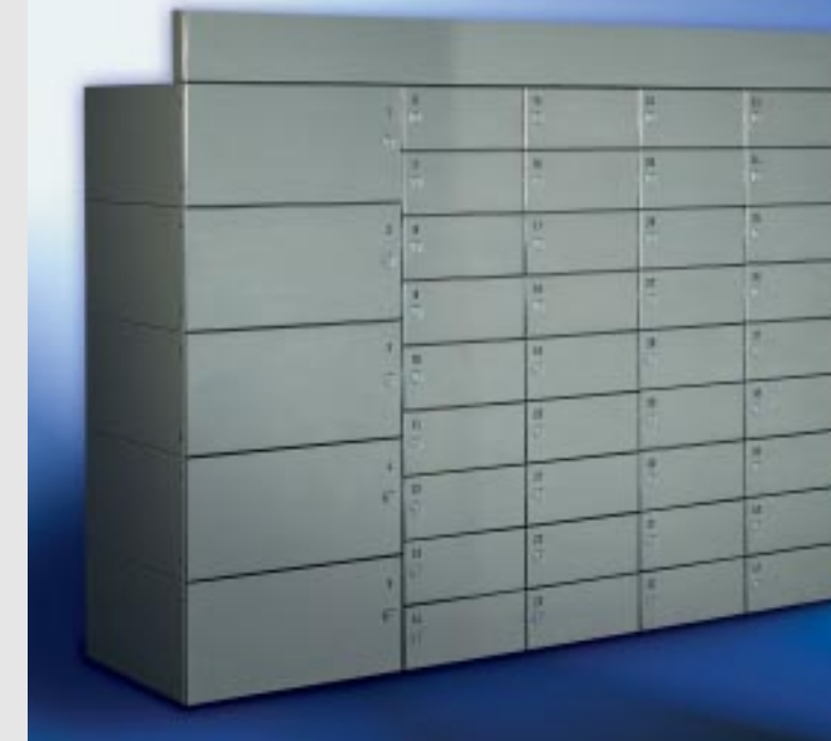
Abb. 231/2 Kastenformat 300 x 110 x 385 mm und Kastenformat-Sonderausführung, ohne Verkleidung.