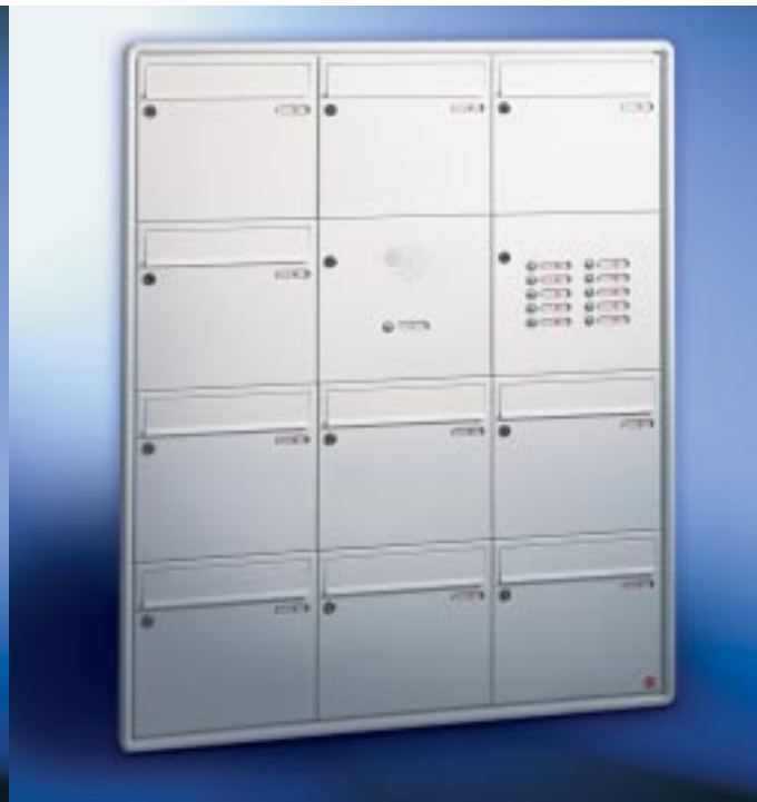
Abb. 56/4 Kastenformat 370 x 330 x 145 mm, mit RS50 und RS4, ALU-Rundprofil-Putzabdeckrahmen RS 3000.