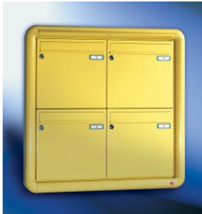
Abb. 56/3 Kastenformat 370 x 330 x 100 mm, ALU-Rundprofil-Putzabdeckrahmen RS 3100, mit Regenabweiser.