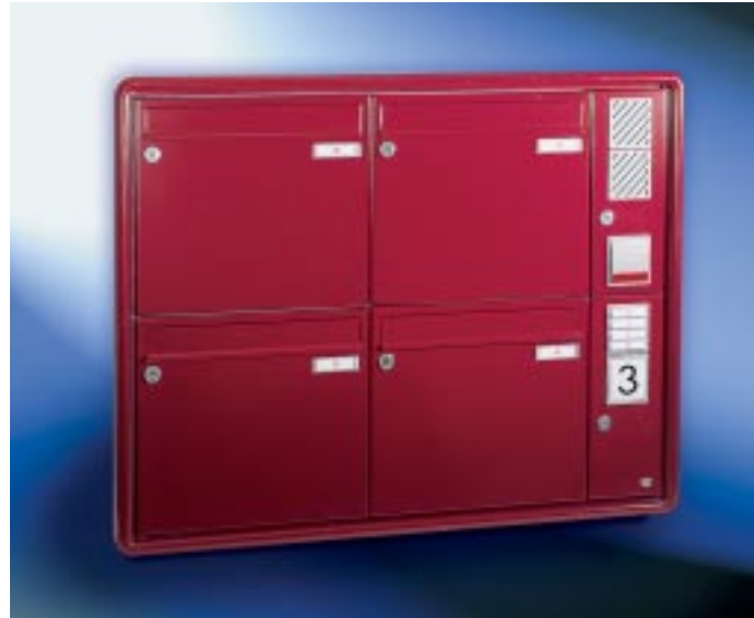
Abb. 56/1 Kastenformat 370 x 330 x 100 mm, beleuchtetes Infomodul, ALU-Rundprofil-Putzabdeckrahmen RS 3000.

Anlagen mit senkrechten Briefkästen. Unterputz.