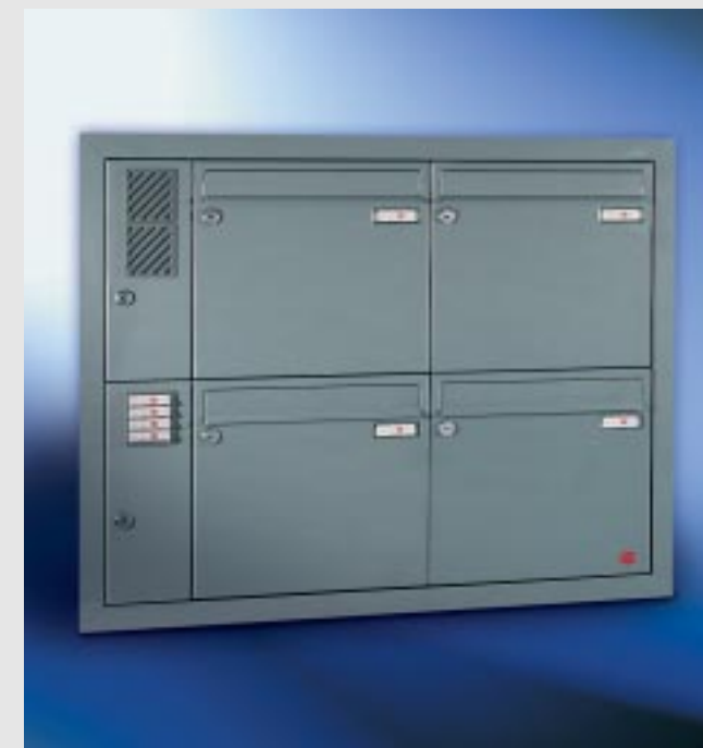
Abb. 55/2 Kastenformat 370 x 330 x 100 mm, ALU-Eckprofil-Putzabdeckrahmen 40 x 48 mm.