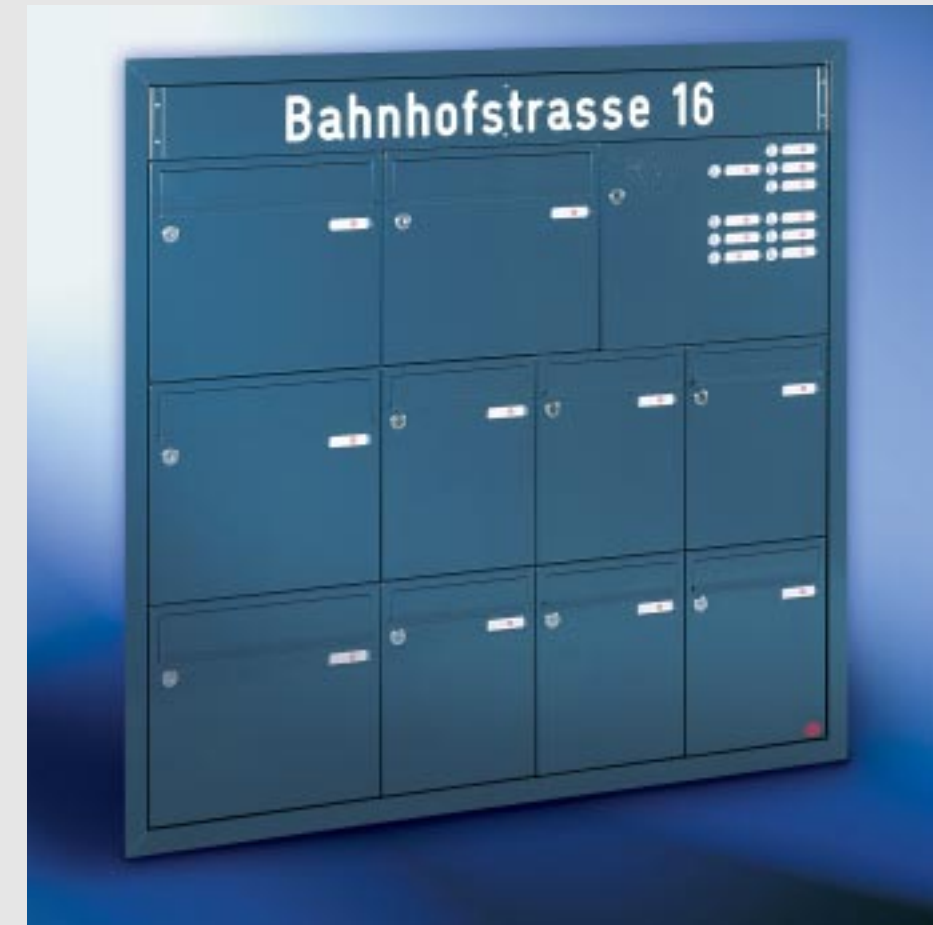
Abb. 55/1 Kastenformat 260 x 330 x 100 und 370 x 330 x 145 mm (mit RS50 ), mit RS4 , Installationskasten in Sonderausführung, Beschriftungskasten, ALU-Eckprofil-Putzabdeckrahmen 40 x 48 mm.