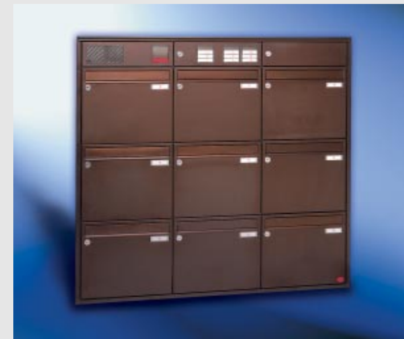
Abb. 55/3 Kastenformat 370 x 330 x 100 mm, ALU-Eckprofil-Putzabdeckrahmen 20 x 32 mm, mit Regenabweiser.