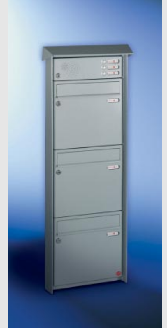
Abb. 57/2 Kastenformat 370 x 330 x 145 mm, mit RS50 und RS4, PRISMA®-Putzabdeckrahmen.