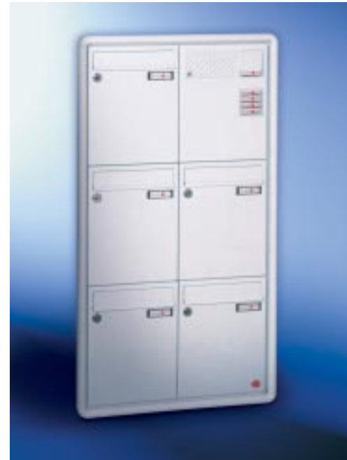
Abb. 56/2 Kastenformat 260 x 330 x 100 mm, ALU-Rundprofil-Putzabdeckrahmen RS 3000.