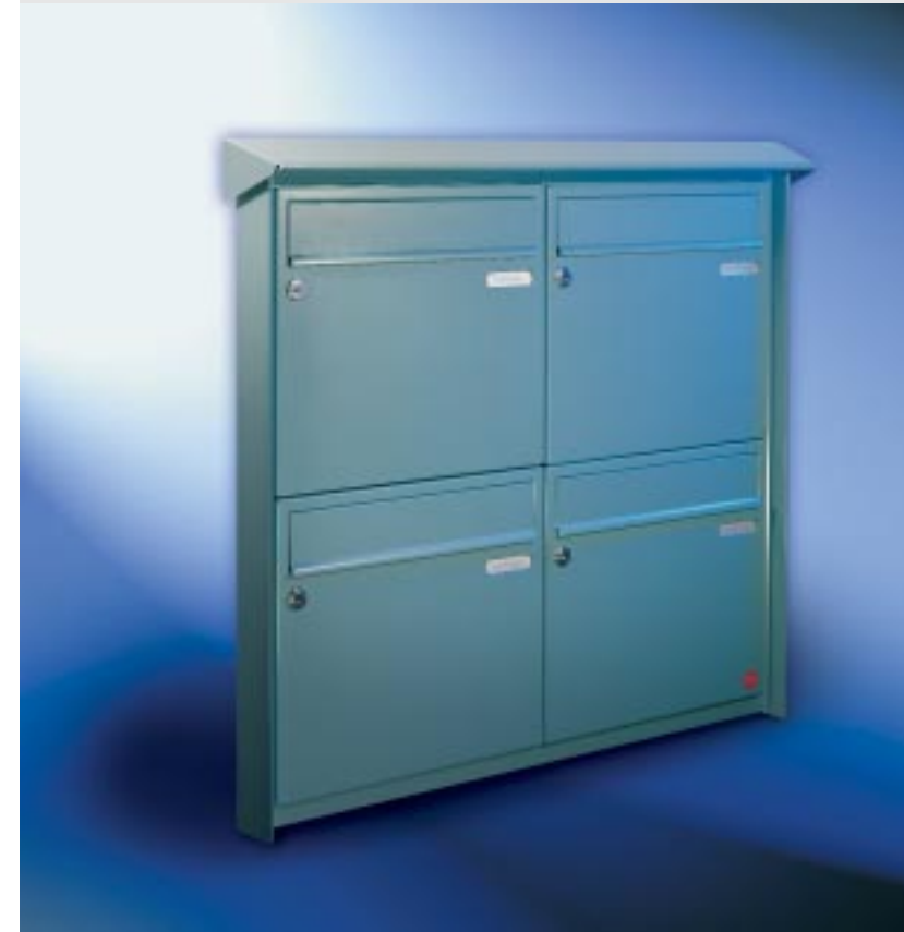
Abb. 57/1 Kastenformat 370 x 330 x 145 mm, mit RS50 und RS4, PRISMA®-Putzabdeckrahmen.