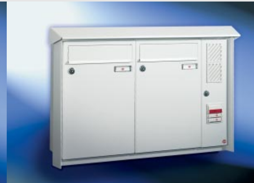
Abb. 57/4 Kastenformat 300 x 440 x 145 mm, mit RS50, PRISMA®-Putzabdeckrahmen.