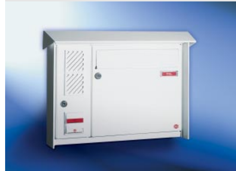
Abb. 57/3 Kastenformat 370 x 330 x 145 mm, mit RS50, Namensschild mit Aufschrift „Werbung, nein danke!“, PRISMA®-Putzabdeckrahmen.