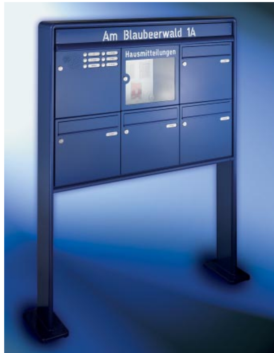
Abb. 46/1 Kastenformat 370 x 330 x 145 mm, mit RS50 , RS4 und Mitteilungskasten, Beleuchtungskasten, ALU-Verkleidungsprofil RS 2000 als Gestell.

Anlagen mit senkrechten Briefkästen. Freistehend.