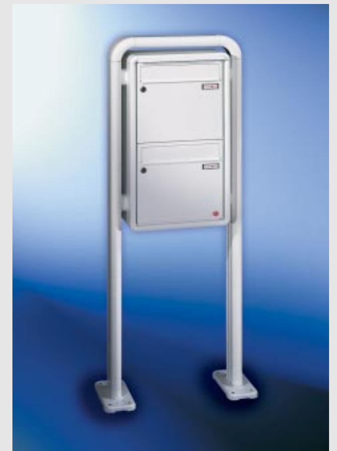
Abb. 47/3 Kastenformat 370 x 330 x 145 mm, mit RS50 , ALU-Verkleidungsprofil RS 2000, ALU-Ovalrohrgestell 105 x 45 mm.