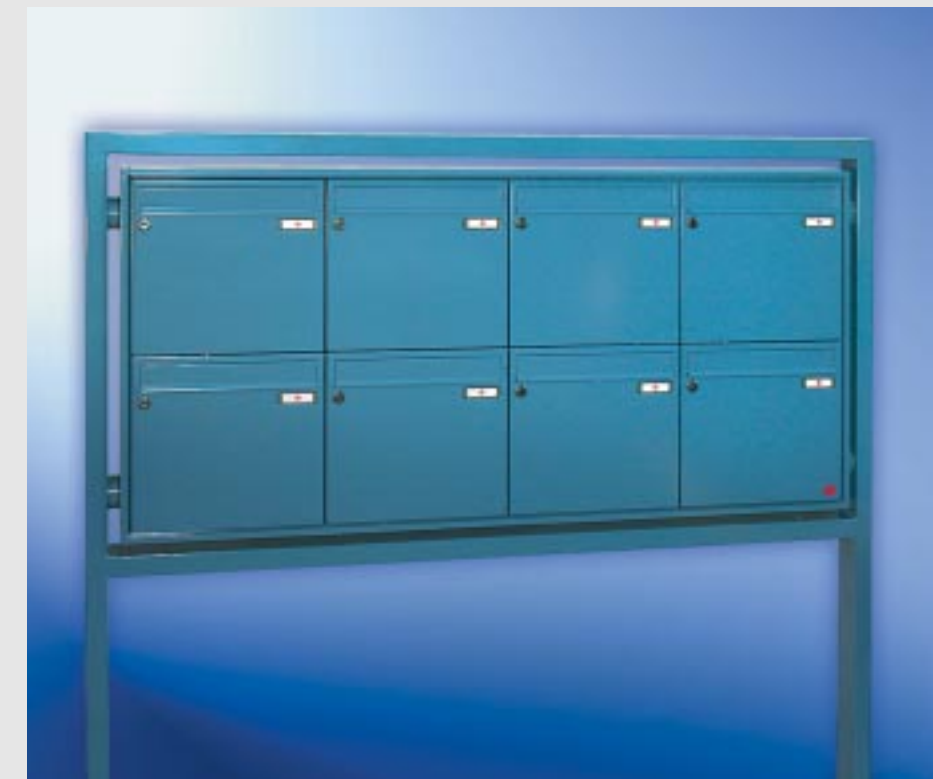
Abb. 49/2 Kastenformat 370 x 330 x 100 mm, ALU-Verkleidungsprofil QUADRA® 4-seitig, Stahl-Rechteckrohrgestell 80 x 40 mm mit unterer Quertraverse.