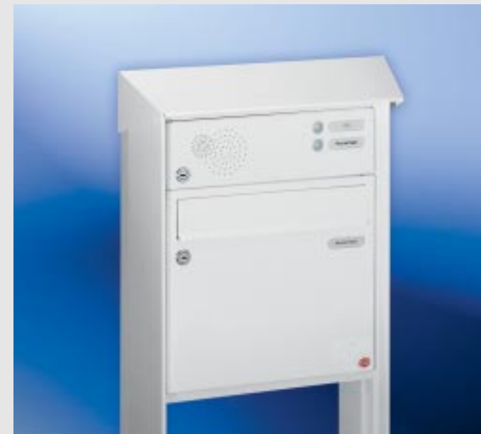
Abb. 45/3 Kastenformat 370 x 330 x 145 mm, mit RS50 und RS4 . PRISMA®-Verkleidung als Gestell.