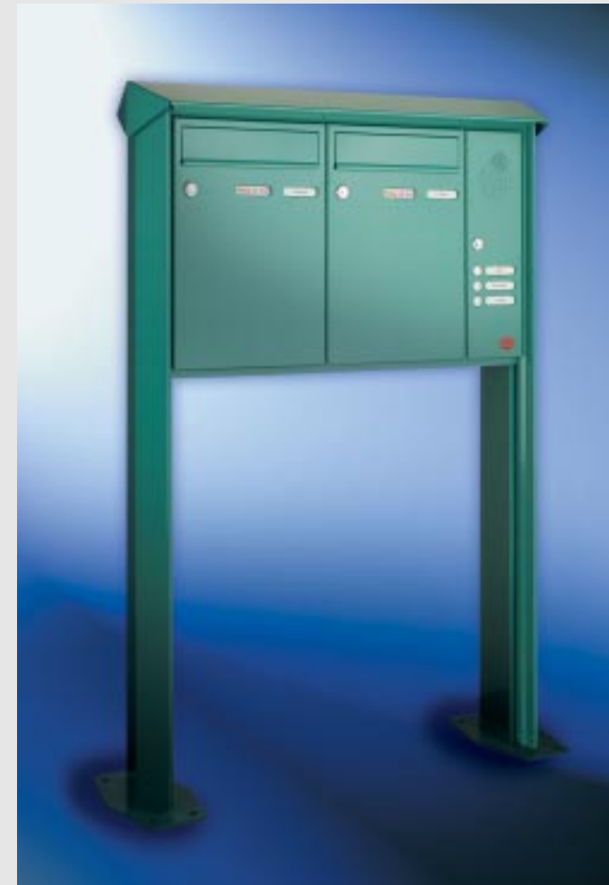
Abb. 45/1 Kastenformat 300 x 440 x 145 mm, mit RS50 und RS4 , 2. Namensschild mit Aufschrift „Werbung, nein danke!“, PRISMA®-Verkleidung als Gestell.