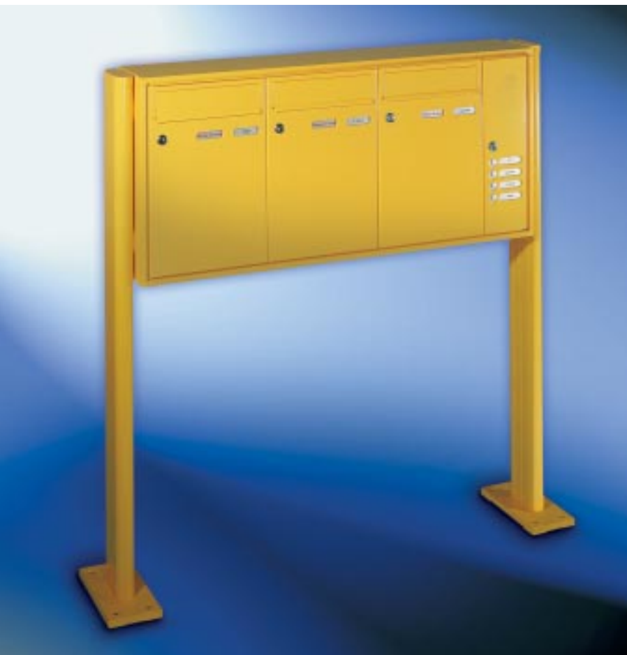
Abb. 48/1 Kastenformat 300 x 440 x 145 mm, mit RS50 und RS4 , 2. Namensschild mit Aufschrift „Werbung, nein danke!“, ALU-Verkleidungsprofil QUADRA® 4-seitig, ALU-Ovalrohrständer 105 x 45 mm.

Anlagen mit senkrechten Briefkästen. Freistehend.