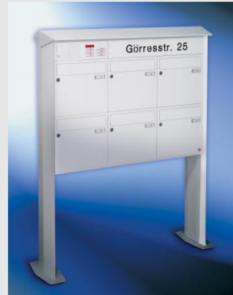
Abb. 45/2 Kastenformat 370 x 330 x 145 mm, mit RS50 , Beschriftungskasten, PRISMA®-Verkleidung als Gestell.