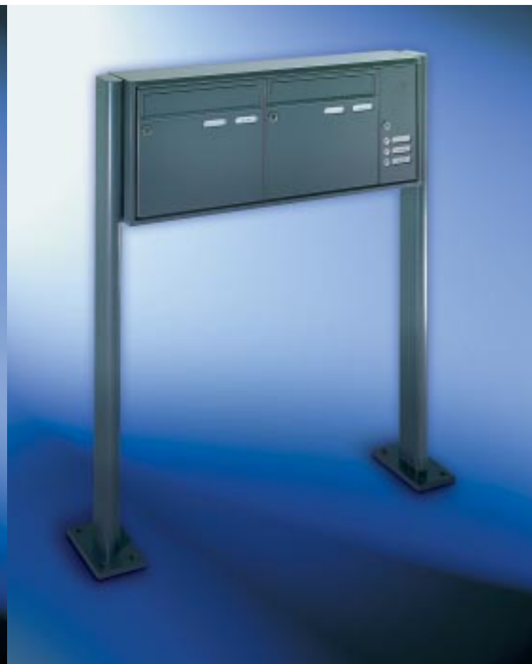
Abb. 48/2 Kastenformat 370 x 330 x 145 mm, mit RS50 und RS4 , 2. Namensschild mit Aufschrift „Werbung, nein danke!“, ALU-Verkleidungsprofil QUADRA® 4-seitig, ALU-Ovalrohrständer 105 x 45 mm.