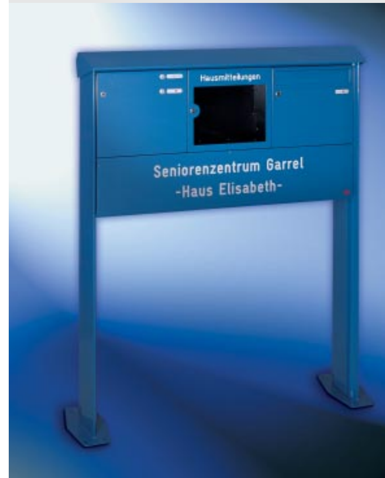
Abb. 47/1 Kastenformat 370 x 330 x 145 mm, mit RS50 und RS4 , Mitteilungskasten, Beschriftungskasten, PRISMA®-Verkleidung als Gestell.