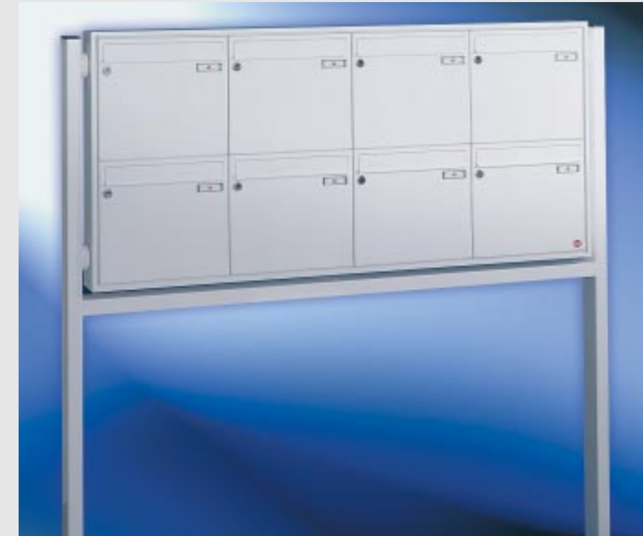
Abb. 49/1 Kastenformat 370 x 330 x 100 mm, ALU-Verkleidungsprofil QUADRA® 4-seitig, Stahl-Rechteckrohrständer 80 x 40 mm mit unterer Quertraverse.