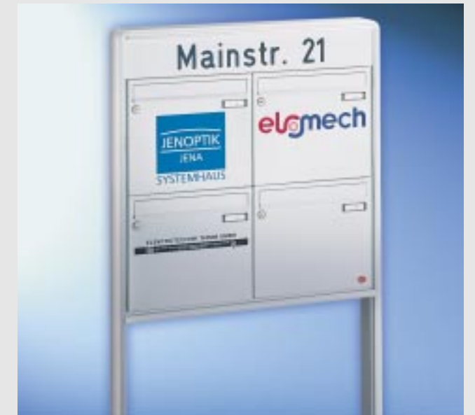
Abb. 47/2 Kastenformat 370 x 330 x 100 mm, ALU-Beschriftungsblende, Türen mit Firmengravuren, ALU-Verkleidungsprofil RS 2000 als Gestell.